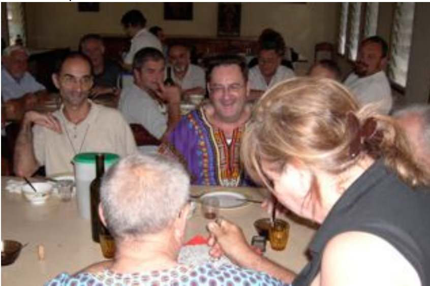
e' il sorriso di Dio si e' fatto ancora piu' evidente con tutti gli auguri della missione.