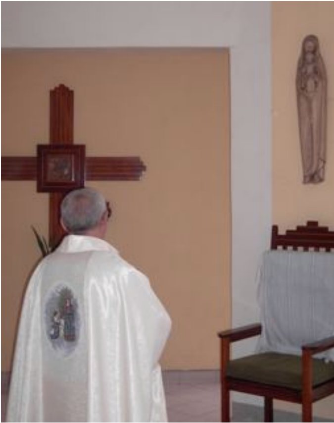
La festa e' poi continuata