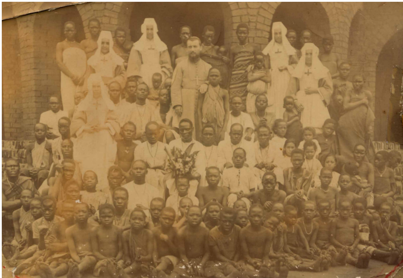
Natale 1904 - Nzama Mission

della Procura dei Missionari Monfortani di Bergamo che ha portato qui' la sua tribu' di giovani e ragazze in occasione delle ultime vacanze estive. La presenza di tanti gruppi della Sant'Egidio, venuti dall'Italia e dal Belgio ci conferma la validita' di questo scambio.