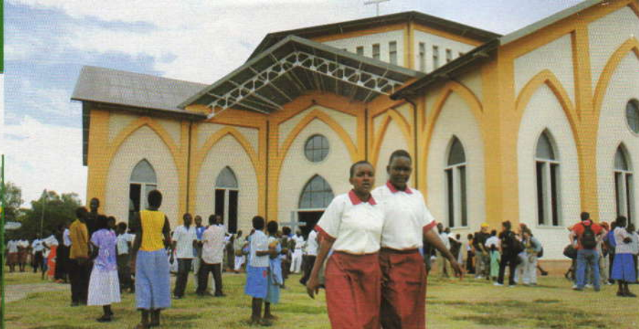
Sopra e a fianco: la chiesa e una classe della scuola donata dagli studenti di Ostia ai bambini di Nkhosha. Nella foto più a sinistra: l'accoglienza riservata dai piccoli africani ai loro amici venuti dall'Italia.